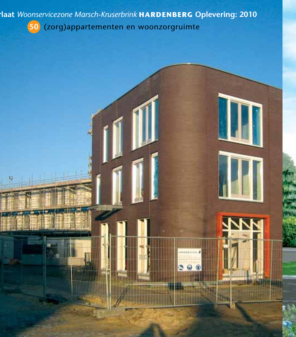
De Overlaat Woonservicezone Marsch-Kruserbrink HARDENBERG Oplevering: 2010 50 (zorg)appartementen en woonzorgruimte