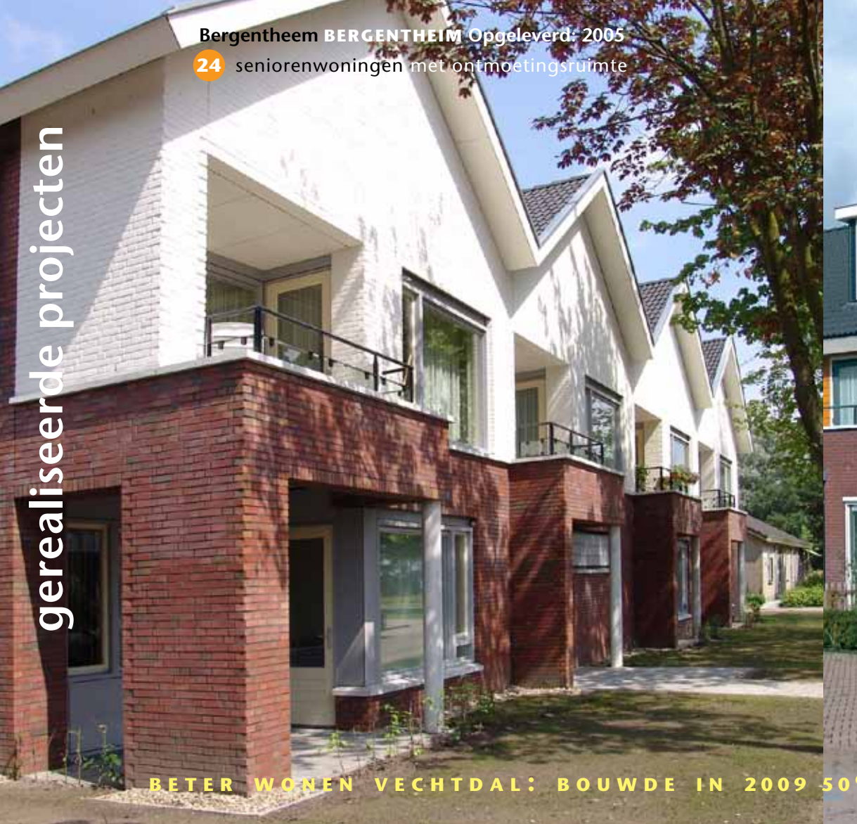
Bergentheim BERGENTHEIM Opgeleverd: 2005

24 seniorenwoningen met ontmoetingsruimte