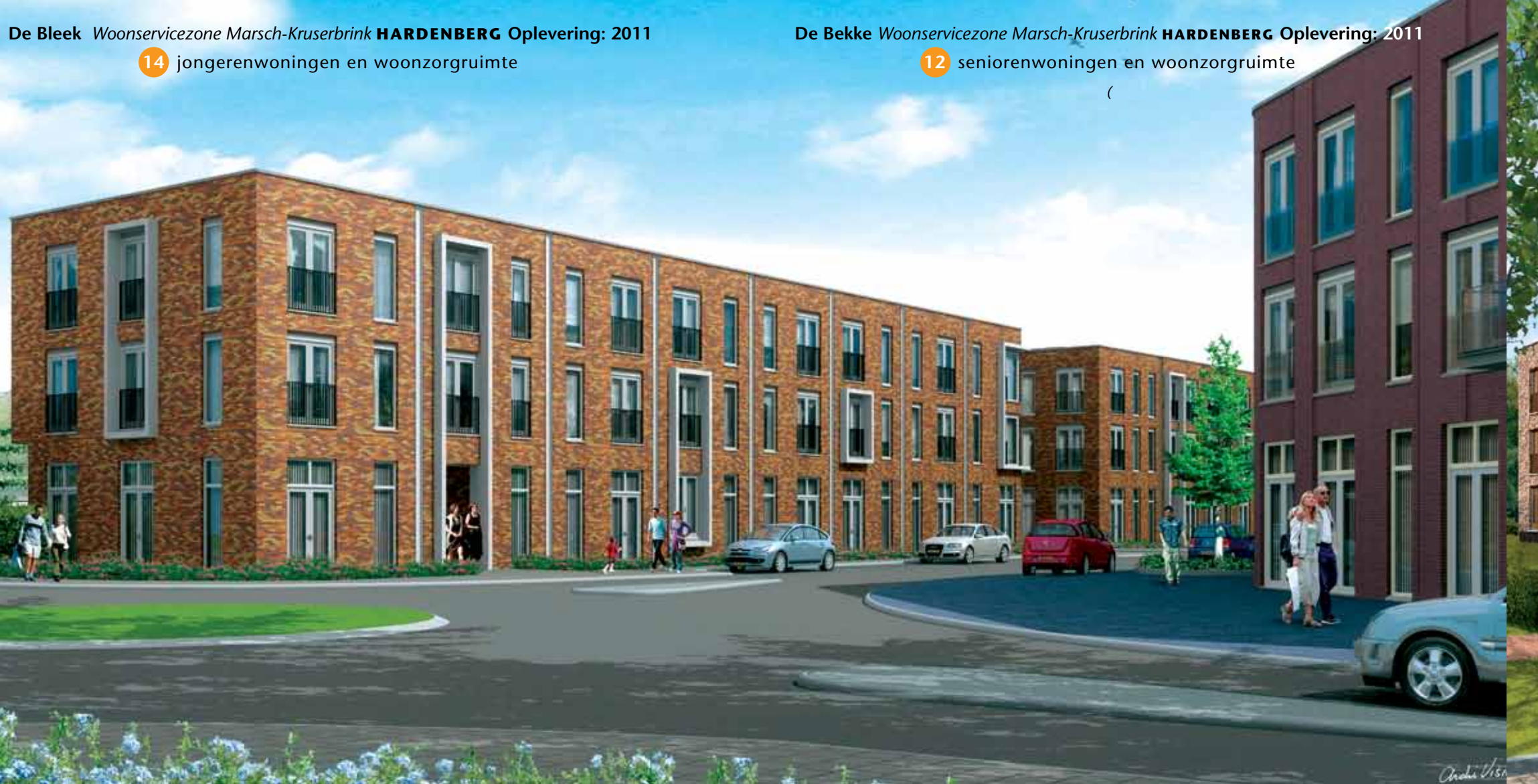
De Bleek Woonservicezone Marsch-Kruserbrink HARDENBERG Oplevering: 2011 14 jongerenwoningen en woonzorgruimte