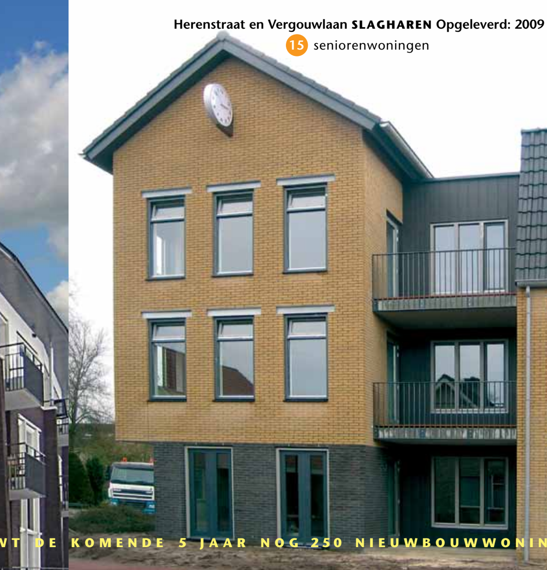
Herenstraat en Vergouwlaan SLAGHAREN Opgeleverd: 2009

41 (zorg)appartementen en bedrijfsruimte