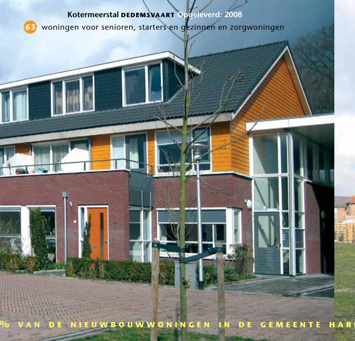
Kotermeerstal DEDEMSVAART Opgeleverd: 2008

24 seniorenwoningen met ontmoetingsruimte