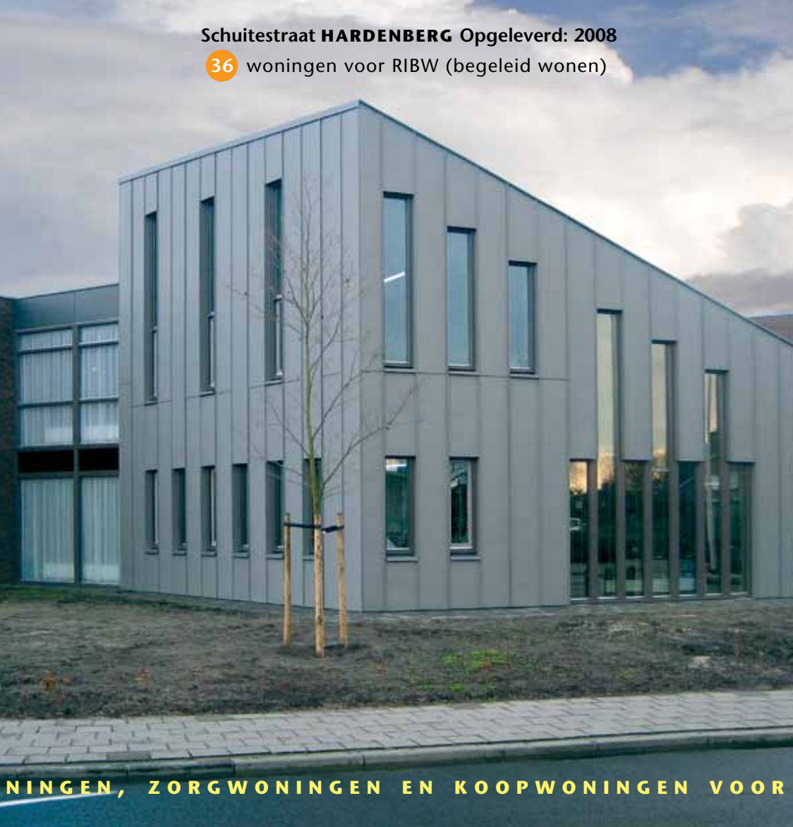
Schuitemstraat HARDENBERG Opgeleverd: 2008

66 woningen voor starters en senioren en zorgwoningen