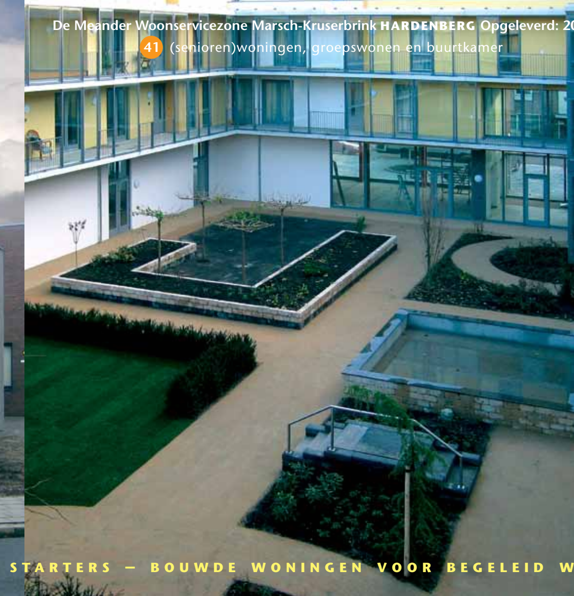
De Meander Woonservicezone Marsch-Kruserbrink HARDENBERG Opgeleverd: 2009

41 (senioren)woningen, groepswonen en buurtkamer