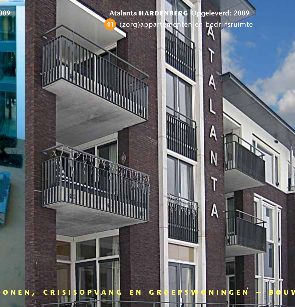
Atalanta HARDENBERG Opgeleverd: 2009

41 (senioren)woningen, groepswonen en buurtkamer