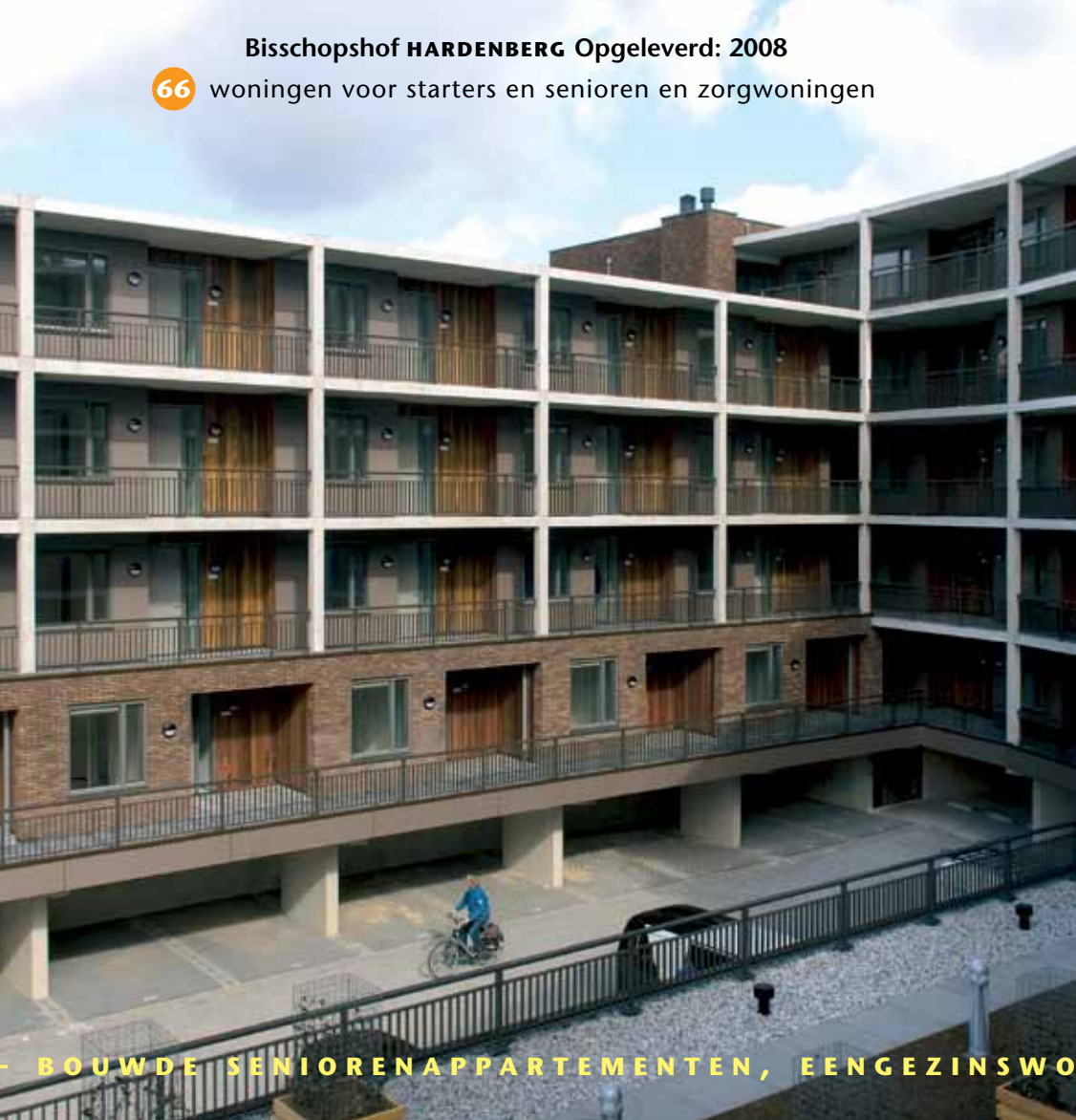
Bisschopshof HARDENBERG Opgeleverd: 2008

36 woningen voor senioren en starters en zorgwoningen