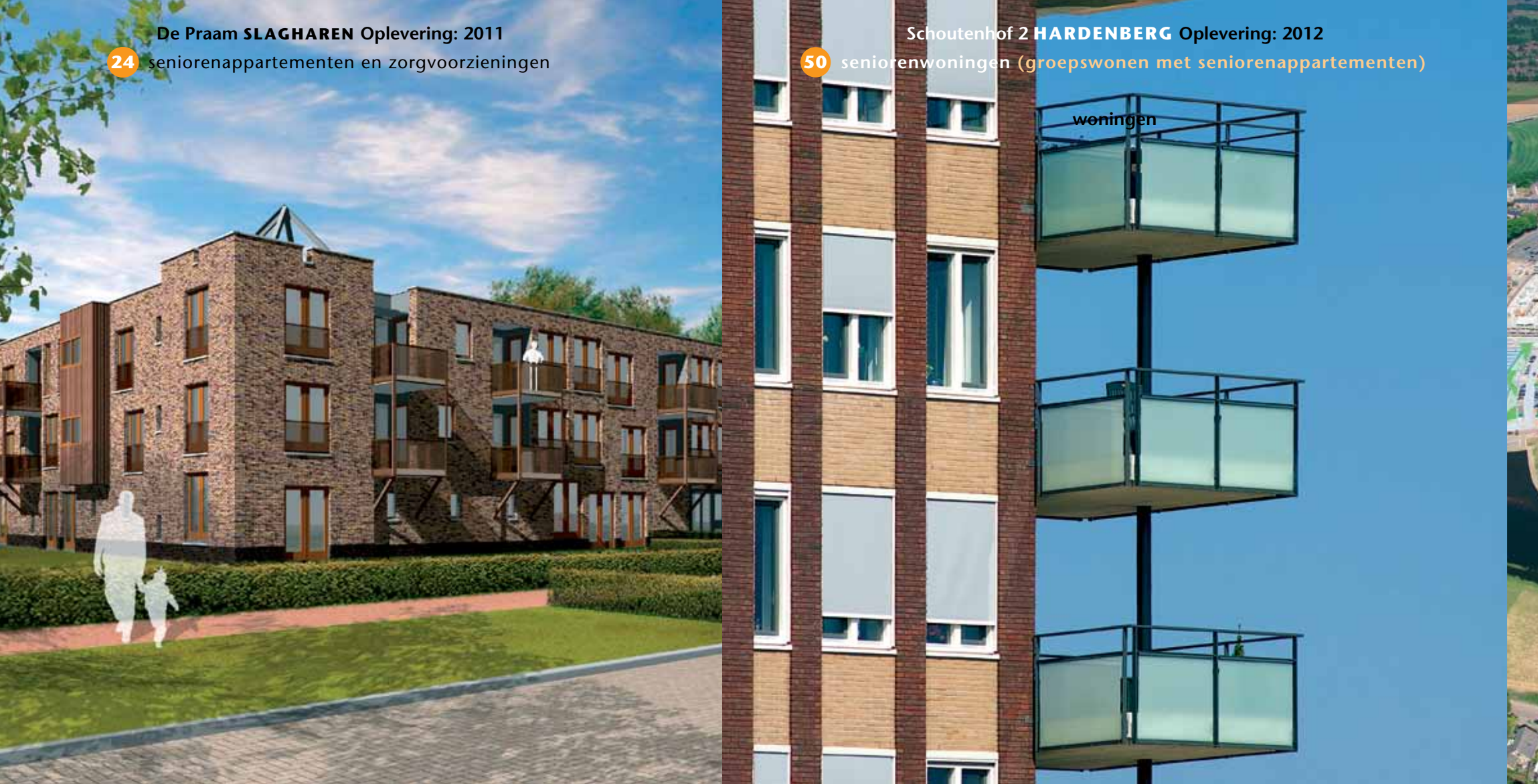
De Bekke Woonservicezone Marsch-Kruserbrink HARDENBERG Oplevering: 2011 12 seniorenwoningen en woonzorgruimte