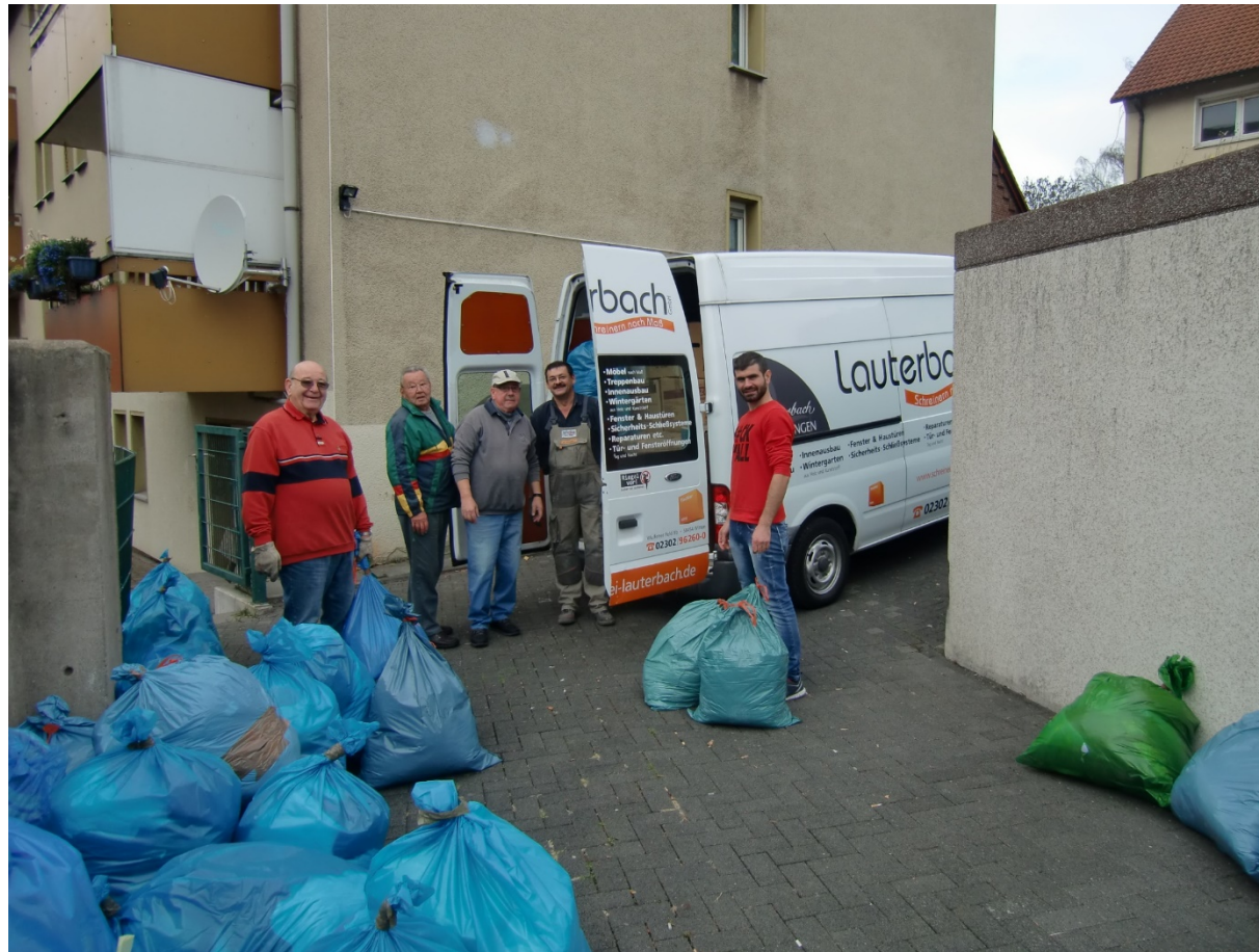
Verpacken von Hilfsgütern