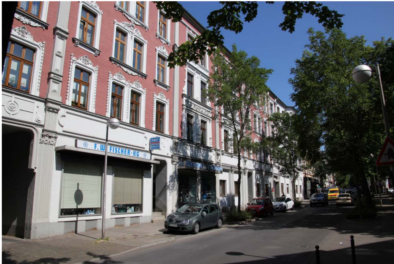
Breite Straße 71-75