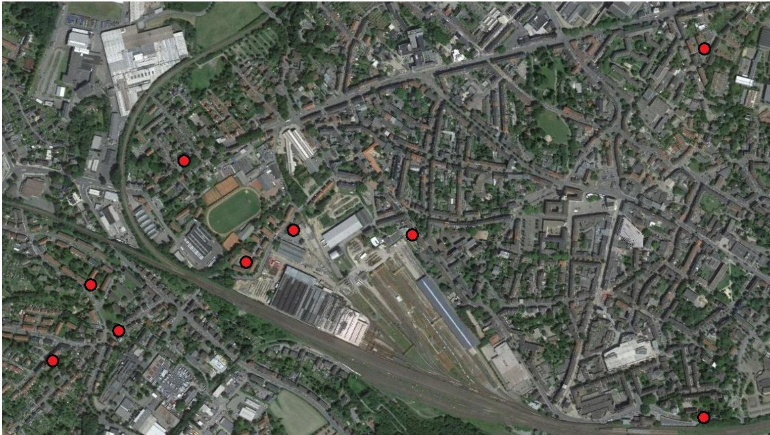
Lage der Wohnungen im Wittener Stadtgebiet