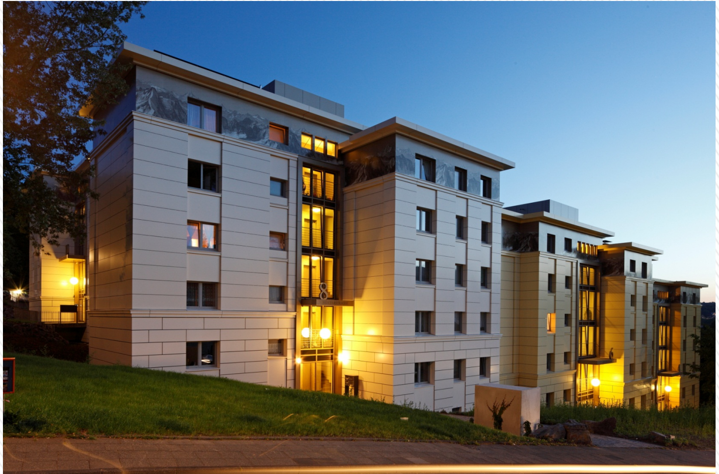
IfG Institut für Genossenschaftswesen