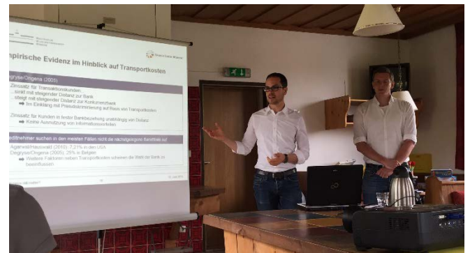
Seminarpräsentation im Sommerseminar

Darüber hinaus bieten wir natürlich auch Themenseminare an, die in Münster abgehalten werden.