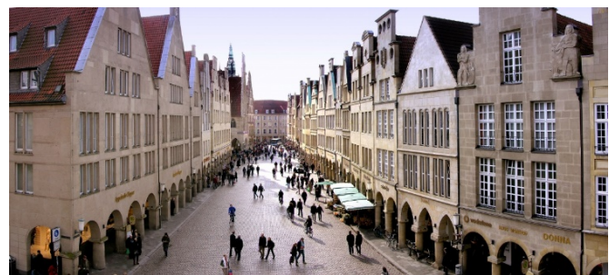
Mitten in der Innenstadt: Der Prinzipalmarkt