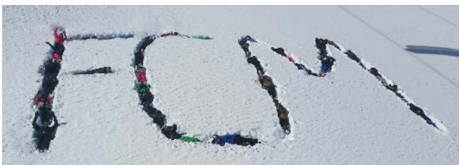
FCM-Spirit beim Skiseminar

Beim Skiseminar lockt der Pitztaler Gletscher mit verschneiten Hängen und einer beeindruckenden Talabfahrt, die auch schon mal in der Schirmbar enden kann. Ski- und Snowboardfahrer jeglichen Fahrstils kommen hier mit Sicherheit auf ihre Kosten. Wenn Ihr noch etwas unsicher auf Skiern steht oder noch einen Tipp für die perfekte Kurve benötigt, dürft Ihr natürlich an den von uns angebotenen Skikursen teilnehmen. Beim gemeinsamen Kochen, gemütlichen Zusammensitzen am Abend oder spätestens bei der Skitaufe knüpft man so Kontakte, die auch über die Seminarfahrt hinaus Bestand haben.