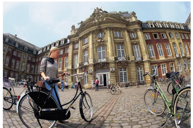
Fahrräder am Schloss der Universität Münster

Dabei ist in Münster alles sehr gut und schnell zu erreichen, nicht zuletzt, weil wir die Fahrradhauptstadt Deutschlands sind: Schloss, Aasee, Mensa, Wochenmarkt, Innenstadt und Kneipenviertel sind jeweils weniger als 500m von Euren Hörsälen entfernt. Die UN hat Münster deshalb bereits mit dem LivCom Award als „Most Liveable City in the World“ ausgezeichnet. Freut Euch also auf eine großartige Zeit im wunderschönen Münster!