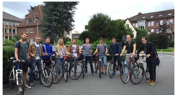
Social Event: Sommerfahrt des FiF-Programms

Familien, einen gesellschaftlichen Mehrwert zu liefern. Last but not least steht den FiF-Teilnehmern auch die einzigartige Möglichkeit offen, ein Praktikum am Risk Management Institute in Singapur zu absolvieren und in dieser spannenden Metropole vielseitige Einblicke in eine dynamische Branche zu bekommen.