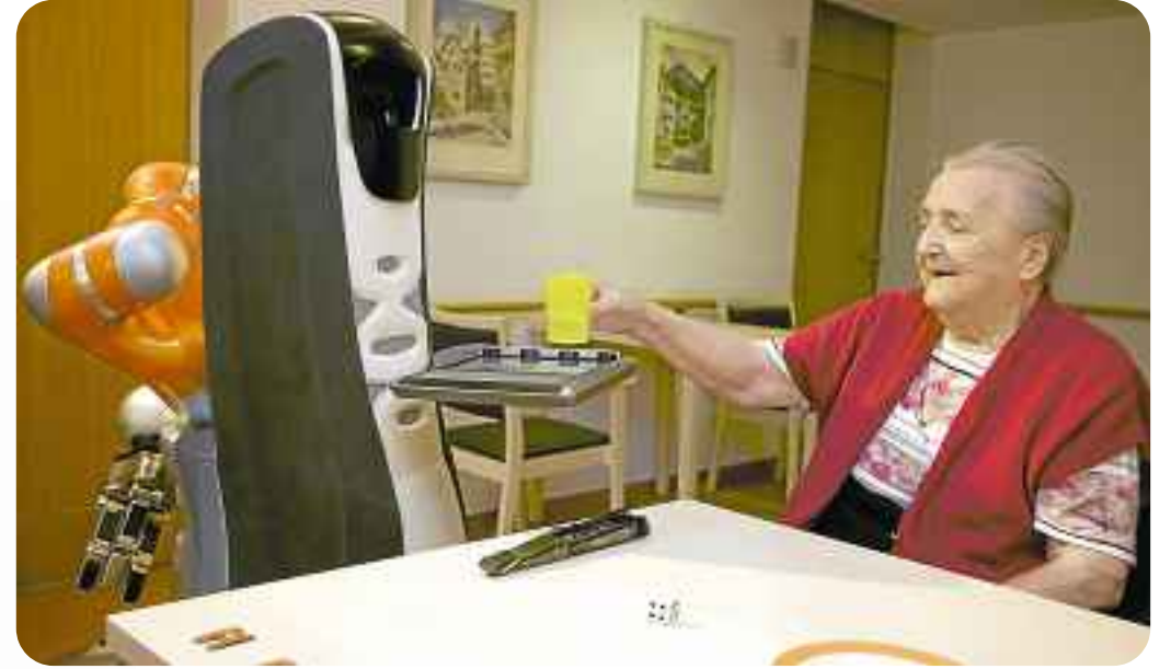
Testphase: Der Roboter „Care-O-bot 3“ serviert ein Getränk – die Bewohnerin eines Pflegeheims in Stuttgart greift zu.