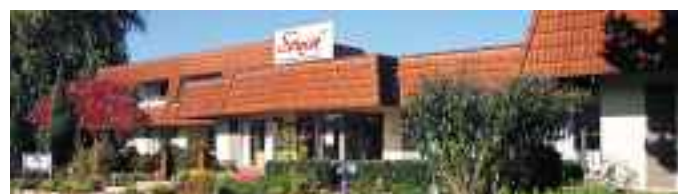
Viele Besucher nehmen eine weite Anfahrt in Kauf, um sich in der Sensá-Ausstellung an der Weseler Straße von neuen Wohnideen inspirieren zu lassen.

Es gibt Wohnräume, in denen fühlt sich jeder gleich wohl: Möbel, Stoffe und Farben harmonisieren miteinander und vermitteln eine angenehme Behaglichkeit. Solche Räume entstehen nicht durch Zufall, sondern sind das Ergebnis einer genauen Planung und Liebe zum Detail. Damit jedes Zuhause