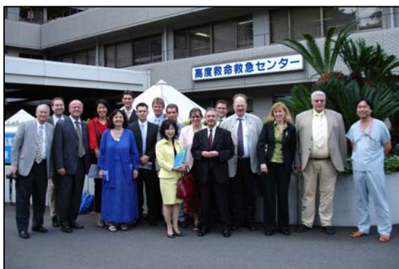
Die Studiengruppe 2005 vor dem Nippon Medical Center, University Clinic, Tokyo