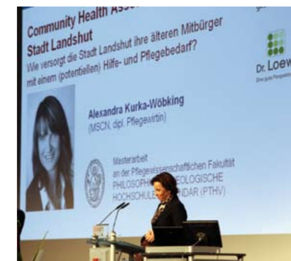
Ministerin Christine Haderthauer hielt die Laudationes.

Das Community Health Assessment hat sich im Rahmen der Untersuchung als ein sehr brauchbares Instrument