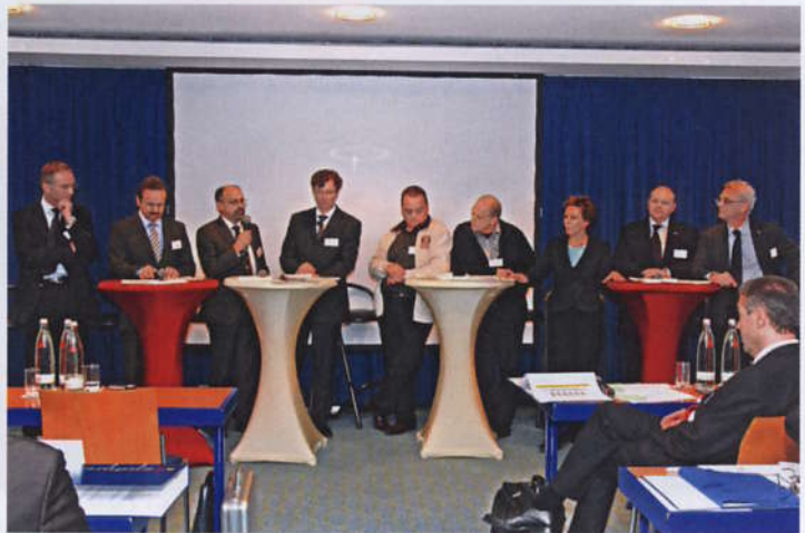
Anschließende Podiumsdiskussion: „Gut, dass sich die REWE Group auf ihre genossenschaftlichen Wurzeln besinnt.“

die aus Investitionen folgen, wie Rücklagen, Weiterbildungsmaßnahmen, Förder- und Partnerschaftsprogramme. Gruppenreformen, Internationalisierung, Meta-Kooperationen und Personalentwicklung kommen den Mitgliedern zugute und erhöhen so den „MemberValue“.